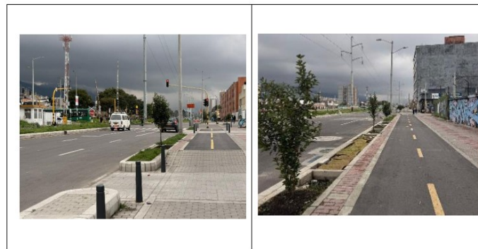
Tabla 1. Registro fotográfico señalización del corredor vial al servicio de la comunidad.

Con el fin de ampliar y respaldar la información descrita, a continuación, se anexa el cuadro de registro fotográfico, en el cual se evidencia la correcta instalación y disposición de la señalización implementada en el tramo habilitado y en los frentes de obra.