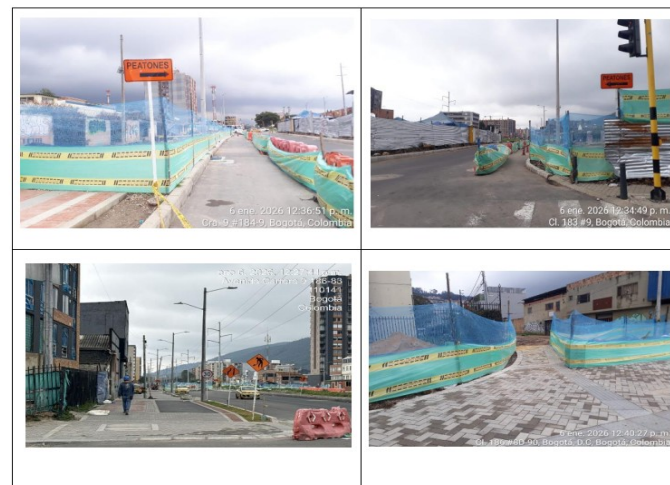
Tabla 1. Registro fotográfico señalización de frentes de obra

Es importante precisar que las congestiones vehiculares generales que se presentan en la zona no se encuentran dentro del alcance contractual del proyecto de la referencia, por lo cual su atención y control exceden las obligaciones técnicas y operativas del mismo.