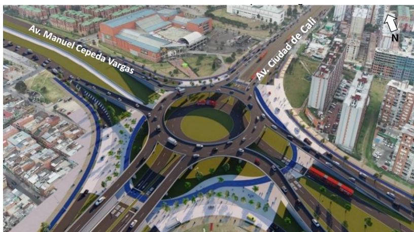
Ilustración 1. Render Glorieta Elevada

Respecto a su petición, la entidad solicitó a la firma interventora CONSORCIO AIRUG 2020, hacer un acercamiento frente a la situación presentada. La interventoría traslada la respuesta del contratista de obra CONSORCIO MAHFER, mediante correo electrónico del 23 de septiembre del presente año, en los siguientes términos: