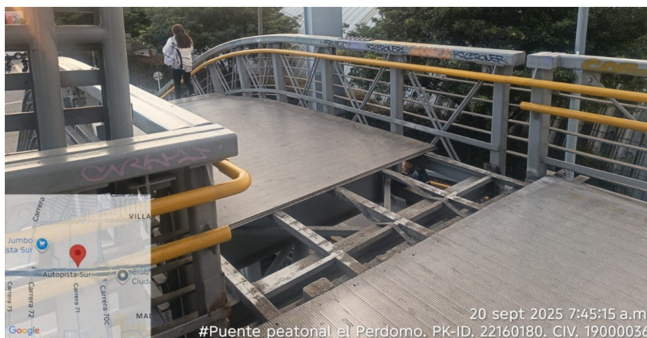
Fotografía No. 1: Tramo de lámina faltante en la superficie del Puente Peatonal.

objeto de su requerimiento, localizado en Puente peatonal Transmilenio - Estación Transmilenio Perdomo (Autopista Sur con Avenida Villavicencio) identificado con el PK_ID 22160181 como se evidencia en el siguiente registro fotográfico: