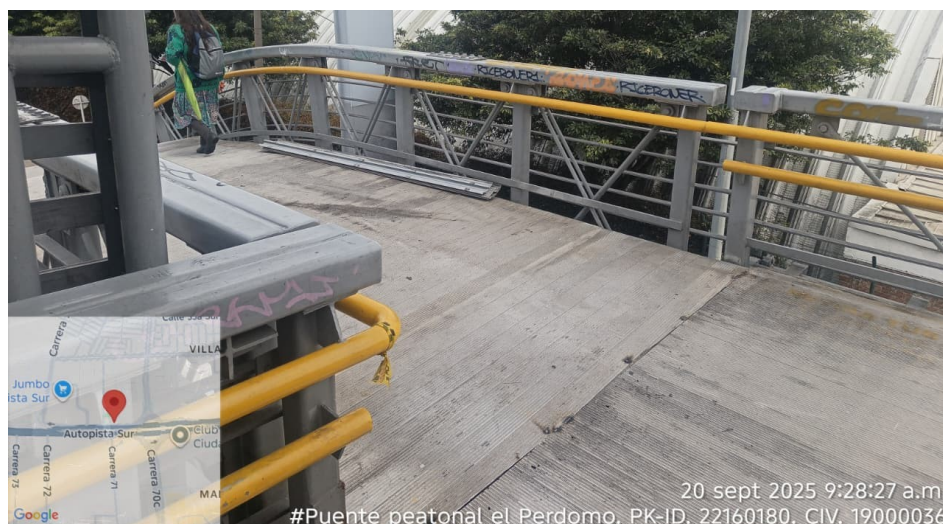
Fotografía No. 2: Estado de la superficie del Puente Peatonal luego de la intervención del IDU.

En consecuencia, damos respuesta dentro de los términos previstos en el artículo 14 de la Ley 1755 de 2015, esperando haber atendido de forma satisfactoria la solicitud presentada, agradecemos su interés reiterando una vez más la voluntad de servicio y