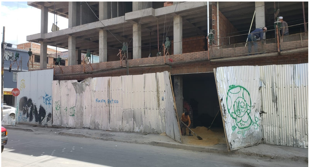
Fotografía 1 – Calle 65 J Sur No. 78 L – 80. Costado Nororiental – Vista Occidente - Oriente

Ahora bien, en visita realizada el día 11 de septiembre de 2025 a la Calle 65J Sur No.87L-80, se evidenció el uso del espacio público (Andén) mediante la ocupación temporal de obra (cerramiento), sin el permiso correspondiente.