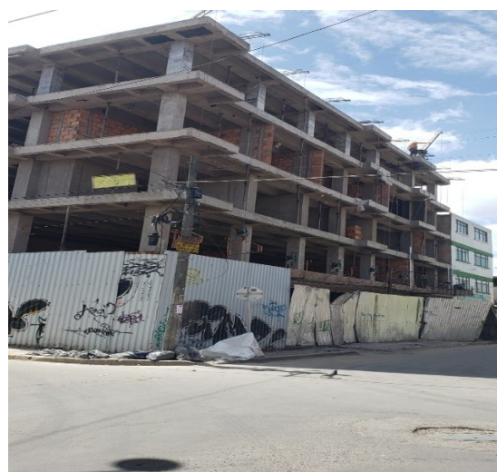
Fotografías 3 y 4 – Vistas Carrera 78L y Calle 65J Sur Esquina (Bosa)

Por lo anterior, solicitamos legalizar el uso del espacio público a ocupar, siendo necesario que se radiquen los documentos y planos descritos a continuación dentro de los cinco (5) días hábiles siguientes al recibo de esta comunicación: