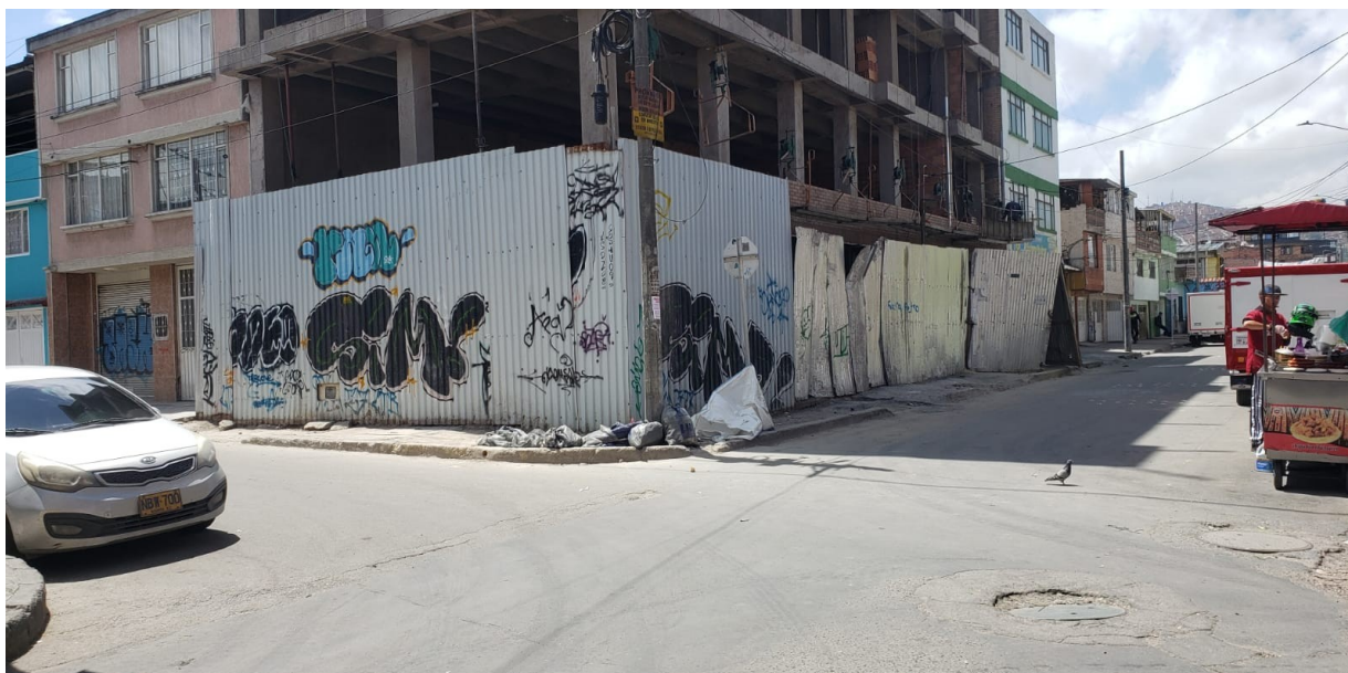
Fotografía 2 – Calle 65 J Sur No. 78 L – 80 Vista desde la Esquina