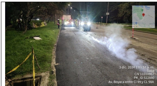
Actividades de parcheo en A.K.Boyacá, costado occidental

Se informa que a la fecha se han realizado actividades de parcheo sobre el corredor de la Avenida Boyacá en el sitio de la solicitud, como se evidencia en el registro fotográfico y se continuará con la ejecución, tan pronto se vaya avanzando con los trabajos de obra nocturnos de acuerdo a los permisos de plan de manejo de tránsito otorgados por la Secretaría Distrital de Movilidad.