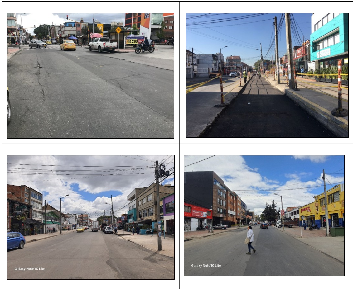
fotografía 1. Intervenciones KR 21 entre CL 53 y CL 56

En los segmentos relacionados anteriormente se llevaron a cabo actividades de parcheos, así como fresado, reemplazo de granulares y carpeta asfáltica, como se evidencia en el siguiente registro fotográfico: