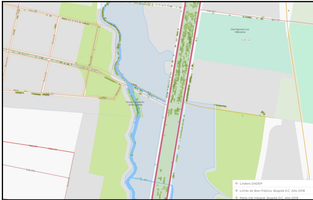
Fuente Mapa Portal Bogotá del IDECA

Información Pública Al responder cite este número