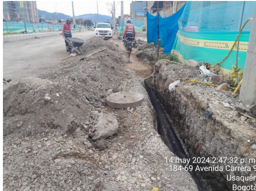
Instalación de geodren K1+470 Sector 4 tramo 2

Información Pública Al responder cite este número