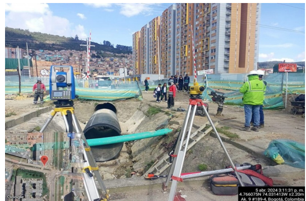
Instalación Tubería 1,6m canal Canaima K1+950

No obstante, el Instituto ofrece disculpas por los inconvenientes causados y de antemano reiteramos nuestra voluntad de servicio, trabajando en crear acciones para contrarrestar las actividades que puedan generar incomodidad a la comunidad.