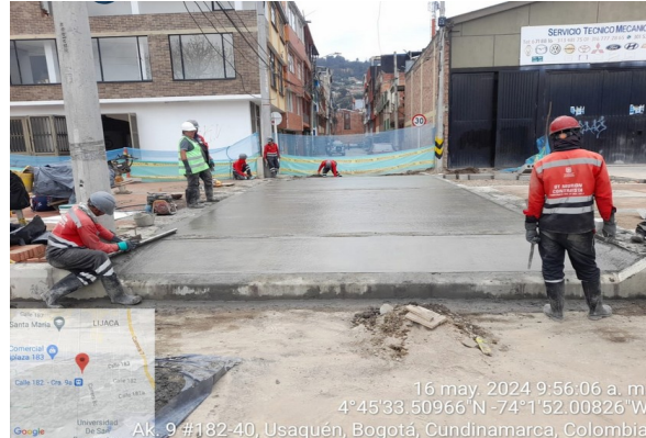
Fundida entrada vehicular con MR-40 sector 3 tramo 1