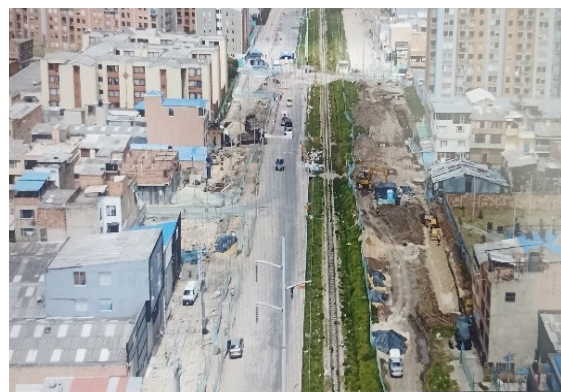
Instalación tubería de 2m Colector Buenavista sector 9 tramo 2