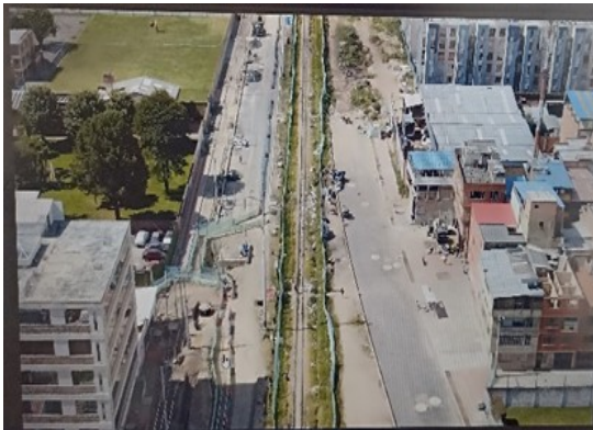
Relleno en rajón para pompeyano sector 4 tramo 2