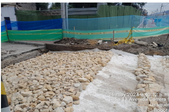
Relleno en rajón para pompeyano sector 4 tramo 2