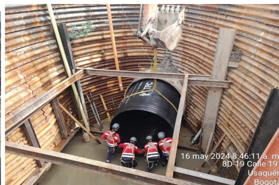
Instalación tubería de 2m Colector Buenavista sector 9 tramo 2