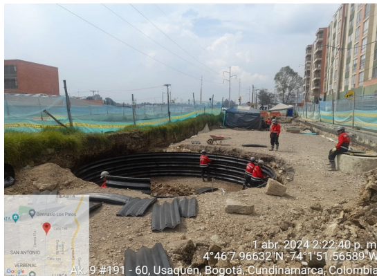
Exvación Lumbrera para Linner K2+280 Red Pluvial.