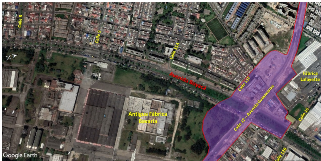
Figura 1. Límites de intervención Cto IDU 1539-2018. Sector Calle 12 con Avenida Boyacá

Así las cosas, amablemente informamos que las actividades de obra que actualmente se están ejecutando sobre la Avenida Boyacá desde la calle 11F hacia el sur no corresponden al contrato de obra IDU 1539 de 2018 y por lo tanto, el Instituto de Desarrollo Urbano Informa que frente a la solicitud del ciudadano (a) en donde menciona: “...ASI MISMO GENERANDO INTERVENCIONES EN LA VIA ALREDEDOR DE UNOS 15 DIAS, ESTO HA GENERADA INSEGURIDAD, DEBIDO A QUE DESDE LA AVENIDA BOYACA CON CALLE 12, HASTA LA AVENIDA BOYACA CON CALLE 8, NO HAY ILUMINACION Y HAY UNA POLISOMBRA, LO QUE PONE EN RIESGO A LOS RESIDENTES DEL SECTOR, PERSONA