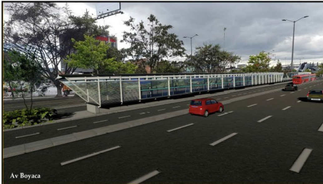
Figura 2 - Render Estacion Av. Boyaca Troncal Calle 80 - (fuente - informe interventoria)

Entrando en materia, con el fin de esclarecer su preocupación acerca de los “15 metros por asfaltar y no es justo seguir esperando y aguantando (...).