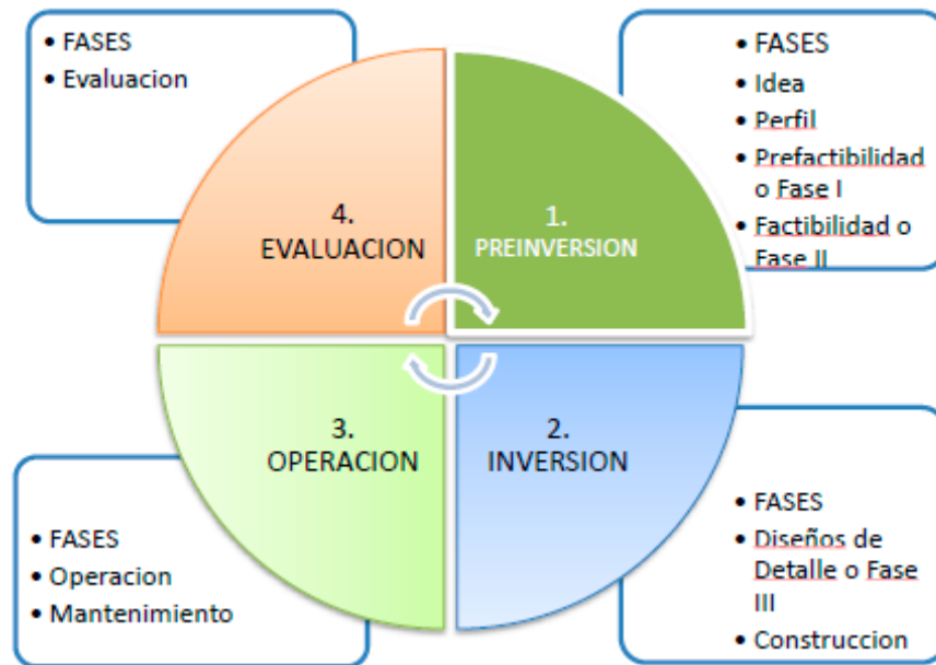
Ilustración 1 Ciclo de vida de los proyectos IDU