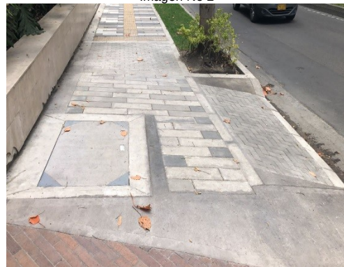
Imagen No 2

Descripción: CL 92 con KR 13A costado sur-occidental