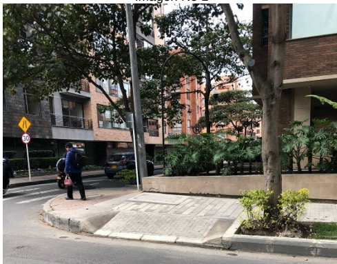
Imagen No 1

Descripción: CL 92 con KR 13A costado sur-occidental