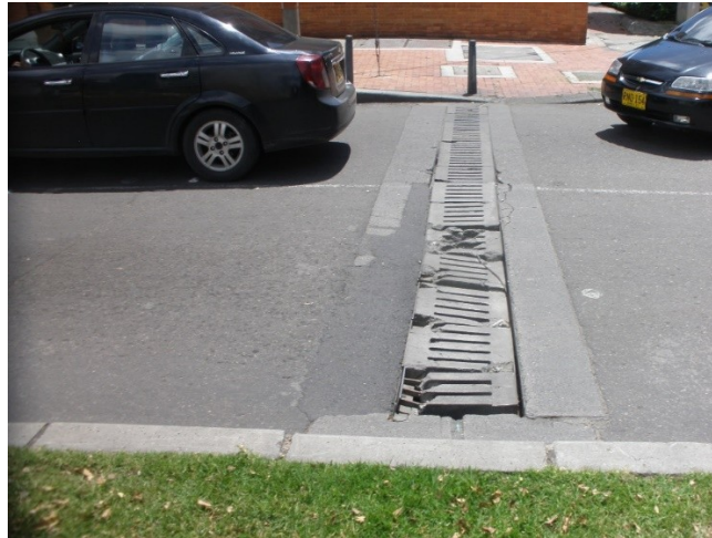
Sumidero transversal de la calle 94 por carrera 18, calzada norte.

Información Pública Al responder cite este número