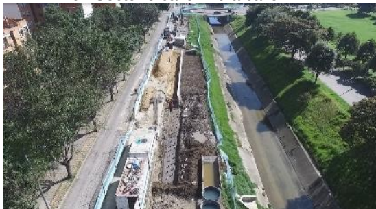
9.. Sector 5 calle 149 a calle 142