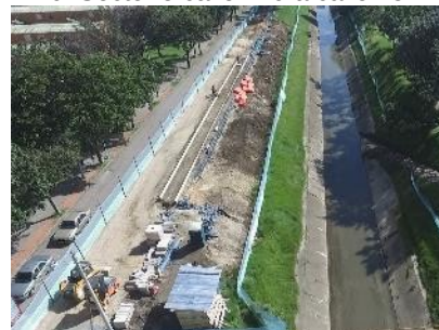
10. Sector 5 calle 149 a calle 152