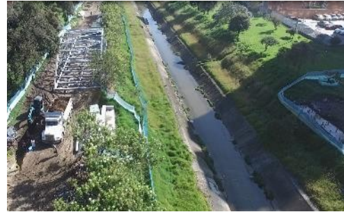
6. Sector 3 puente bicipeatonal calle 143A