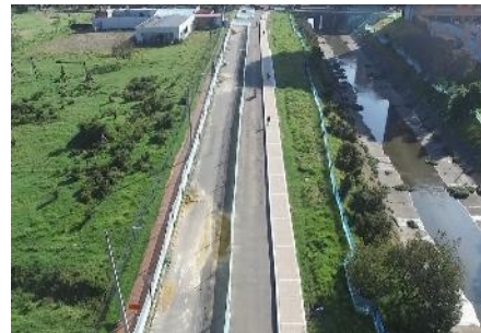
2. Sector 1 Calle 131B a calle 134