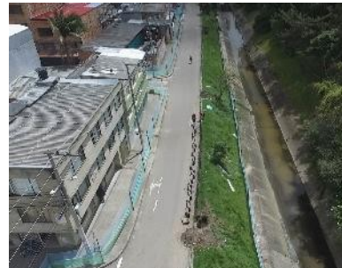
14. Sector 7 calle 153 a calle 163b

Ahora bien, se aclara al peticionario que los diseños elaborados bajo el contrato IDU 1650 de 2019, dan cumplimiento estricto a lo dispuesto en la cartilla de andenes y espacio público, relacionado con la implementación e instalación de losetas táctiles y osetas guías a lo largo de los senderos peatonales del proyecto, así como la construcción de las rampas de acceso universal a lo largo del proyecto, finalmente, en respuesta a su inquietud, se comunica que la fecha de finalización actual del contrato es el 22 de marzo de 2024.