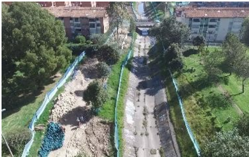
7. Sector 4 calle 145A a calle 149