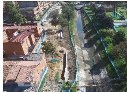
8. Sector 5 Calle 149 a calle 142