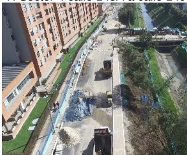
9.. Sector 5 calle 149 a calle 142