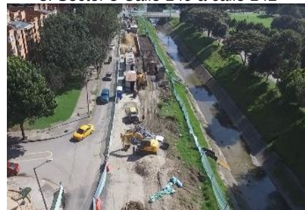
10. Sector 5 calle 149 a calle 152