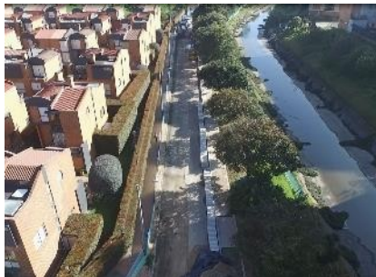
1. Sector 1 Calle 129 a calle 131B

Por lo anterior, se comunica que, el contrato actualmente se encuentra en ejecución de la etapa de construcción, que cuenta una ejecución a la fecha ejecución del 24%, producto de la ejecución de actividades ejecutadas desde el inicio de la etapa de construcción a la fecha, como excavación, Instalación de sardinel, bordillo de confinamiento, lleno en material granular, instalación de losetas e instalación de adoquín, imprimación con emulsión asfáltica, extensión y compactación de material granular estabilizada con asfalto, y construcción de estructuras de estabilización y contención, actividades silviculturales, implementación de planes de manejo de tráfico, cerramientos, tal y como se evidencia en el siguiente registro fotográfico: