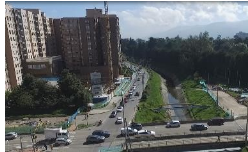
12. Sector 6 Calle 152 a calle 153