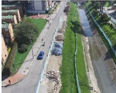
11. Sector 5 Calle 149 a calle 152

Información Pública Al responder cite este número