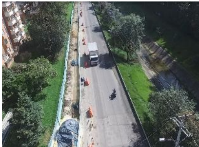
13. Sector 6 calle 152 a calle 153