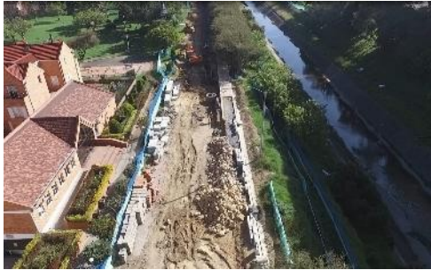
5. Sector 3 calle 138 a calle 145A

Información Pública Al responder cite este número