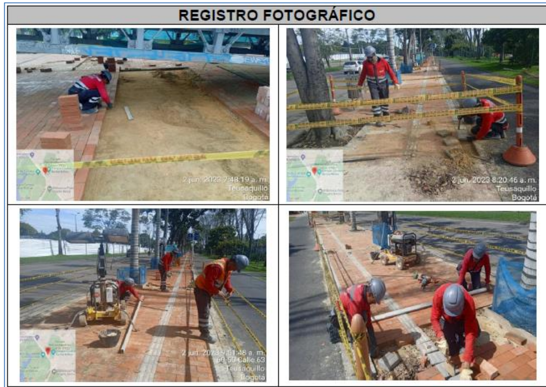
Registro fotográfico de actividades de obra – Calle 63 entre Carrera 60 y Carrera 68, costado norte.