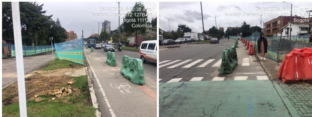
Maletines verdes, propiedad de la SDM.

Los maletines que pertenecen al Contrato 1550 de 2018, son los de color naranja que se observan en las fotografías y que van pegados al sardinel oriental de la Av. Boyacá junto a la polisombra.