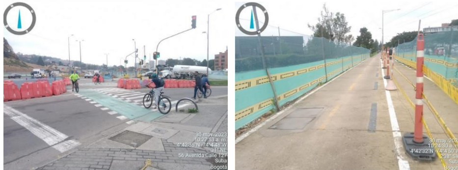
Ciclorrutas provisionales a cargo del contrato IDU-1550-2018

De conformidad con lo anterior, teniendo en cuenta que los maletines de color verde que se encuentran ubicados en el costado oriental de la Avenida Boyacá son propiedad de la Secretaría Distrital de Movilidad – SDM y en virtud del artículo 21 de la ley 1755 de 2015 por medio de la cual se regula el Derecho Fundamental de Petición y se sustituye el correspondiente del Código de Procedimiento Administrativo y de lo Contencioso Administrativo; se remite copia de la presente y de su petición a la Secretaría Distrital de Movilidad – SDM, para que dentro de lo de su competencia atienda la misma y brinde una respuesta de fondo, completa y de manera oportuna.