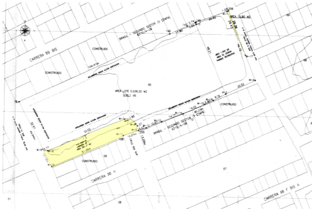
Figura 2: Tomada del plano urbanístico CU4 B310/4-09 aprobado por Curaduría urbana