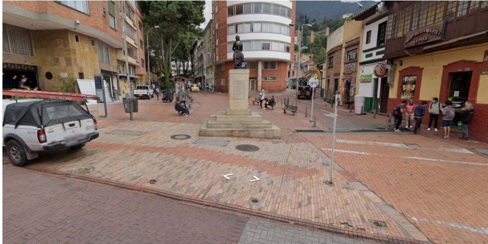
Ilustración 1 Ubicación de la Plazoleta “La Pola”