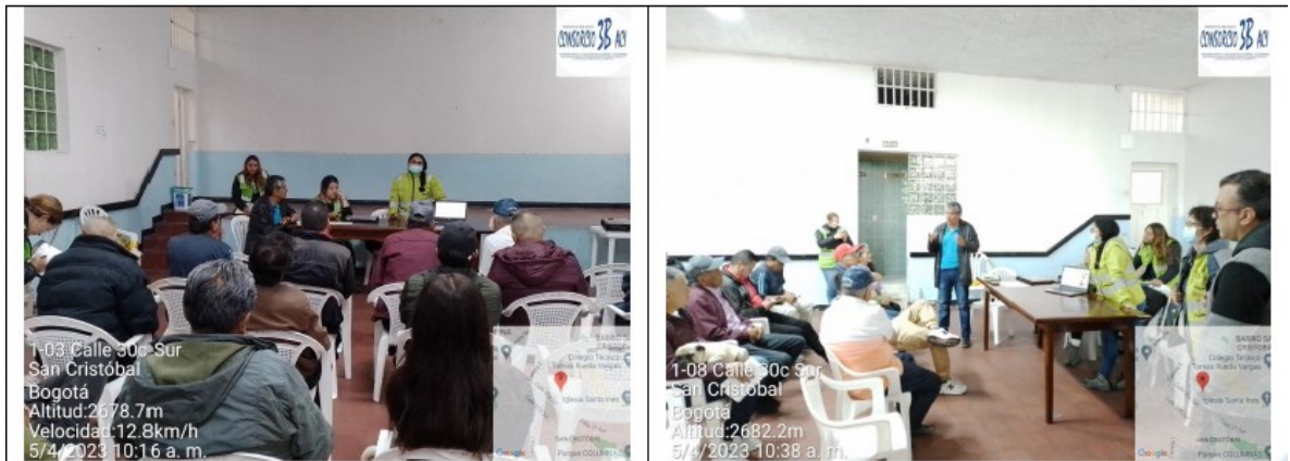
Imagen No-. 1. Reunión presencial Barrio Bello Horizonte Proyecto La Araña, Localidad de San Cristóbal.