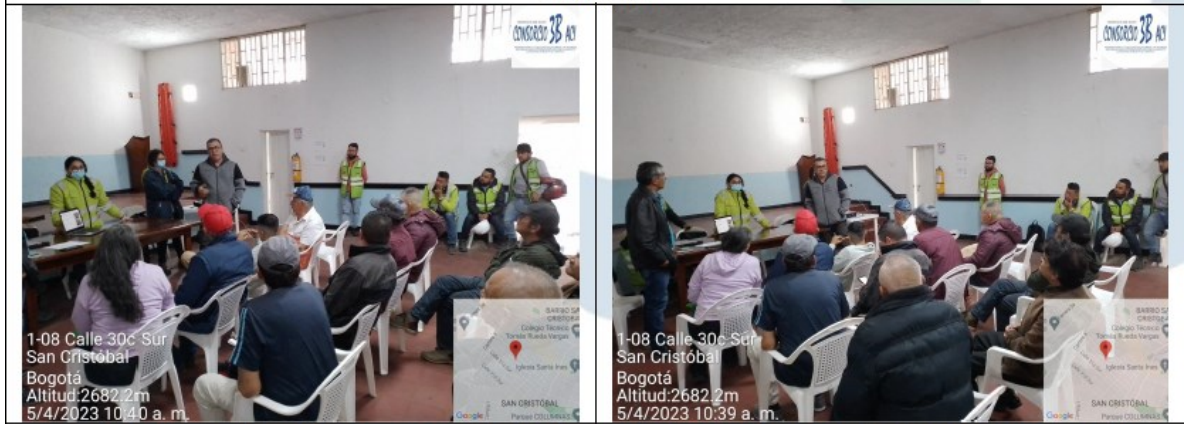
Imagen No-. 2. Reunión presencial Barrio Bello Horizonte Proyecto La Araña, Localidad de San Cristóbal..

Se anexa a la presente en tres (03) folios copia del oficio SAL-23-006355 (Consecutivo IDU No. 20235260595182) del 17/04/2023.