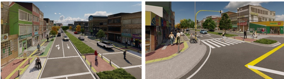
Ilustración 1. Imágenes renderizadas del Paseo Comercial de Kennedy

A continuación, se muestran algunas imágenes gráficas (render) que se tienen como resultado de los avances de la Etapa de Estudios y Diseños y que muestran una aproximación de cómo sería el desarrollo del Proyecto.