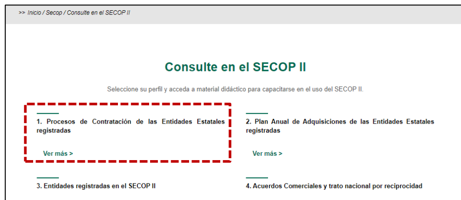
Figura 1. Página Consulta Secop II.

Ingresando al ítem 1. Procesos de Contratación de las Entidades Estatales registradas (Ver Figura 1), se abrirá una pestaña para la búsqueda del proceso de contratación con diferentes parámetros (Ver Figura 2).