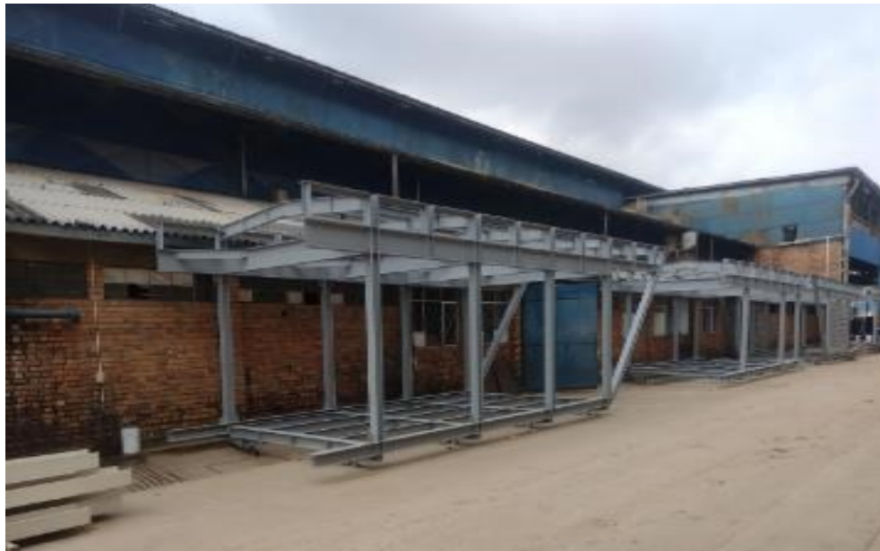
Figura 3 – fabricación vagón nuevo

Paralelamente se ha venido trabajando en la fabricación del vagón en taller, el cual se encuentra a la fecha en el siguiente estado, lista para ser despachada a la obra: