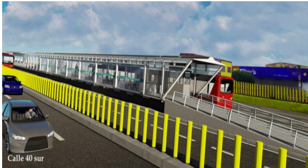
Figura 2 - Render estación Calle 40 sur - (fuente - Factibilidad IDU)

En la estación Calle 40 Sur se han adelantado a la fecha actividades de: