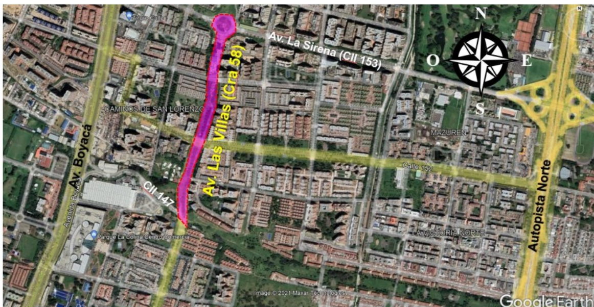
Localización del proyecto.

Al respecto se informa que, el IDU adelantó el proceso IDU-CMA-SGDU-032, con el cual se adjudicó el contrato IDU-1788-2021 cuyo objeto es la "ELABORACIÓN DE LOS ESTUDIOS Y DISEÑOS PARA LA CONSTRUCCIÓN DE LA AVENIDA LAS VILLAS (AK 58) EN EL TRAMO COMPRENDIDO DE LA AVENIDA TRANSVERSAL DE SUBA (AC 147) A LA AVENIDA LA SIRENA (AC 153) EN LA CIUDAD DE BOGOTÁ". Dicho contrato fue suscrito con la firma JORGE FANDIÑO SAS y la interventoría del contrato de consultoría se encuentra a cargo del CONSORCIO UG – SIS, mediante contrato IDU-1803-2021 adjudicado dentro de la convocatoria IDU-CMA-SGDU-054-2021. La información de los procesos IDUCMA-SGDU-032-2021 e IDU-CMA-SGDU-054-202, puede ser objeto de consulta en el portal web Sistema Electrónico de Contratación Pública - SECOP II.