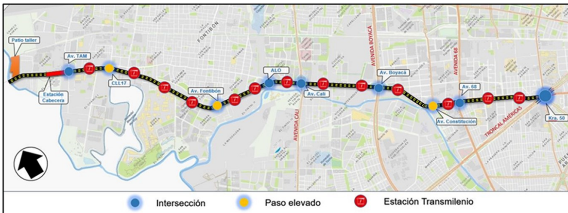
Principales elementos del corredor. Fuente: IDU-1475-2017

Gracias a su extensión de 11.4km y dado que recorre la ciudad de oriente a occidente desde la Cra. 50 hasta el límite del Distrito, la Av. Centenario presenta importantes puntos de intersección con la malla vial arterial. Teniendo así, cinco intersecciones principales: Intersección con Carrera 50, Intersección con Av. 68, Intersección con Av. Boyacá e intersección con Av. Ciudad de Cali e Intersección con Av. del TAM. Para todas estas, se han definido diferentes soluciones con un rango variable de complejidad alineado con las necesidades del proyecto en cada punto.