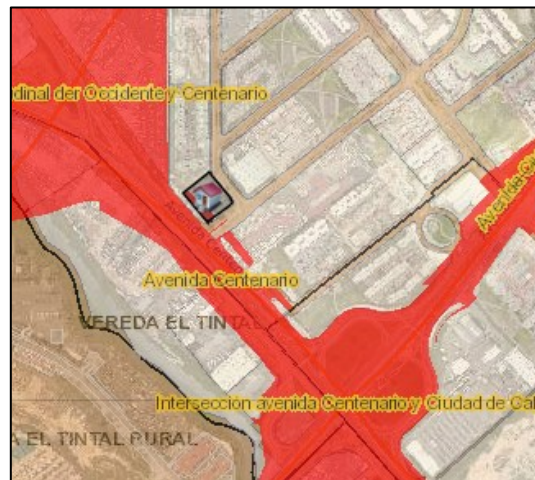
Localización del predio.

En relación con lo anterior, es preciso señalar que, la Dirección Técnica de Predios de la Entidad está elaborando insumos prediales, dentro de los cuales se encuentra el registro topográfico, el cual, determina exactamente las áreas afectación, cesiones, etc., de cada uno de los predios, una vez se cuente con tal información, será contactado, si es requerido, de conformidad con los procedimientos establecidos por la Entidad.