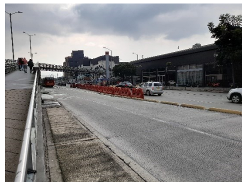
Salida sur estación CAD - Transmilenio